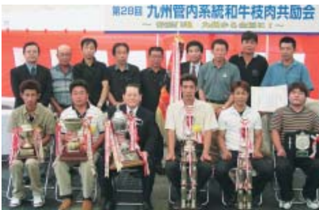
第28回九州管内系統和牛共励会にてJA宮崎経済連が5年連続団体賞を受賞!(本誌2P)