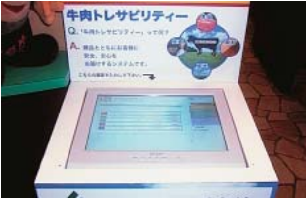
JA宮崎経済連 肉牛トレサビリティシステムの紹介(写真は焼肉レストランアパス 店頭)(P11)