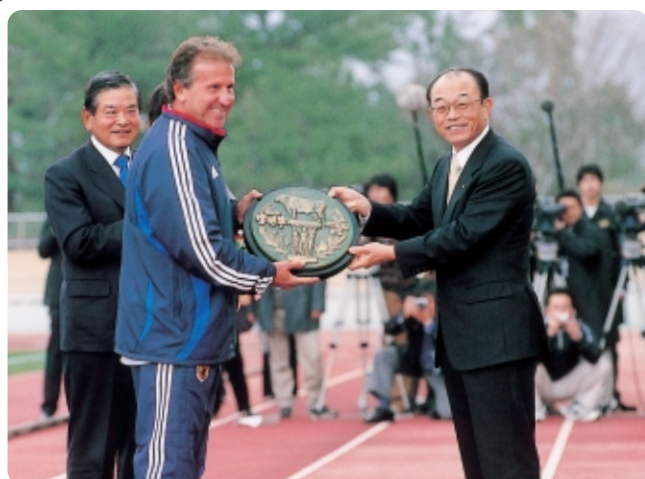
よりよき宮崎牛づくり対策協議会からサッカー日本代表チームへ「宮崎牛」を贈呈(平成18年1月29日、左から川淵チェアマン、ジコ監督、安藤知事)