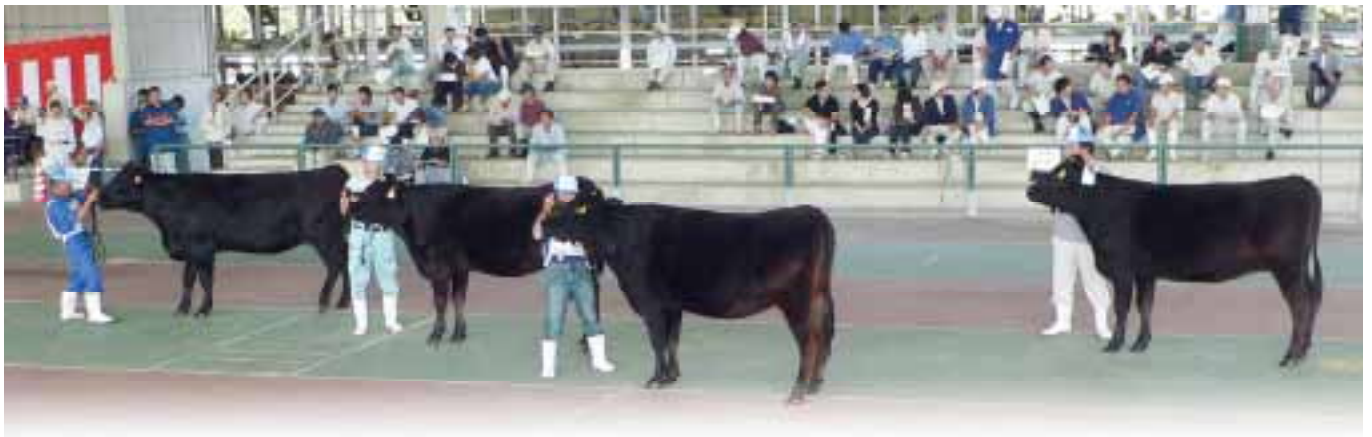
グランドチャンピオン賞【第2区優等賞首席・西臼杵(系統雌牛群)奥高系】

統を引き継ぐもの、あるいは、地域の改良の基礎をつくるとともに今後の遺伝的多様性を担う雌系統を掘り起こすことを狙いとした出品区です。この区は、4頭をもって1セットとし、雄系については出品牛全てが始祖牛の遺伝子保有確率を概ね20%以上確保する必要があります。加えて、出品牛は産肉能力並びに繁殖能力についても一定条件を満たす必要があります。この区には、雄系として南那珂支所から『美福10系』、西諸支所から『富栄系』、西臼杵支所から『奥高系』、雌系として児湯支所から『はるさん系』がそれぞれ出品され、4セットの合計16頭が出品されました。