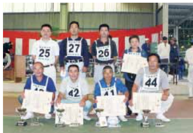
グランドチャンピオン賞【第2区優等賞首席・西白柀(系統雌牛群)奥高系】

互の血縁係数が6%以上確保されている必要があります。そして、産肉能力並びに繁殖能力についても一定条件を満たすと同時に、今出品対策共進会では2産以上していることを条件としています。この区には県内7支所から合計28頭が出品されました。