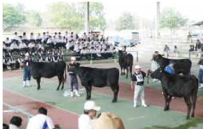
高鍋農業高等学校の生徒さんが審査を見学