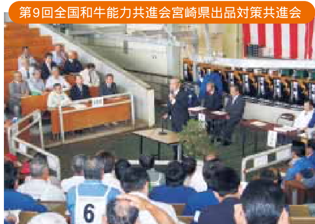
第9回全国和牛能力共進会宮崎県出品対策共進会

第1区・繁殖雌牛群(第9回全共第5区に該当)は、地域の繁殖牛集団の斉一化を図ることを目的とした出品区です。成雌牛4頭をもって1セットとし、出品牛相