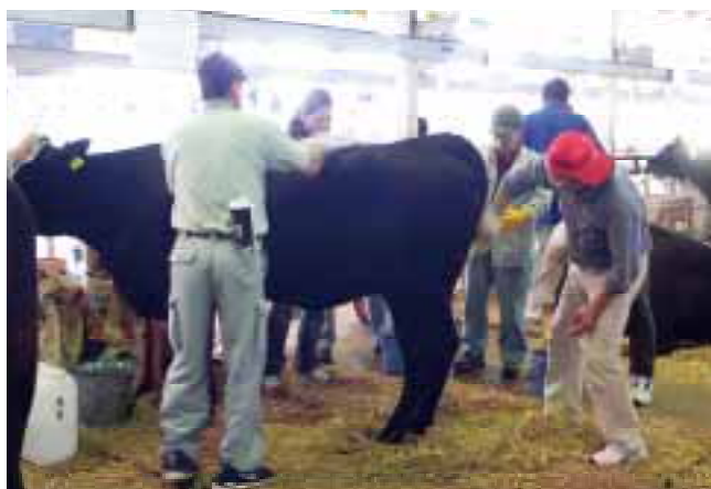
愛牛に入念な手入れが施される!