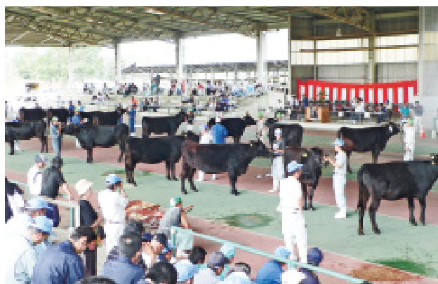
第9回全共宮崎県出品対策共進会を開催! (本誌5P)