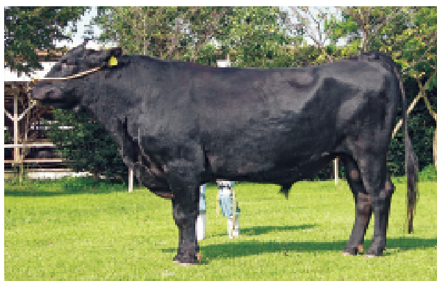
「勝平正」号 (種雄牛紹介 本誌9P)