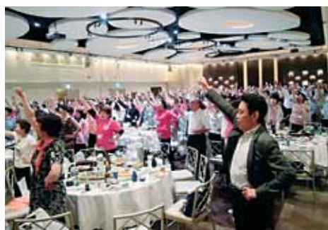
(写真：宮崎大会) (H25.7月開催)