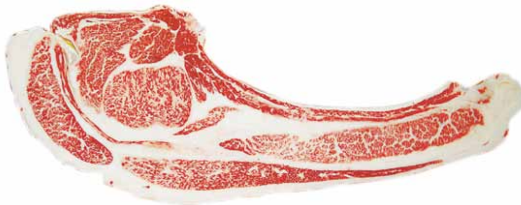
金賞に輝いた枝肉